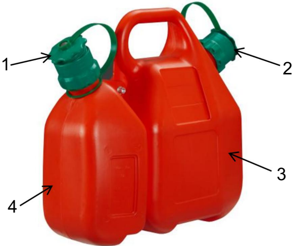
1. Tapón de combustible uno 2. Tapón de combustible dos 3. Botella uno 4. Botella dos