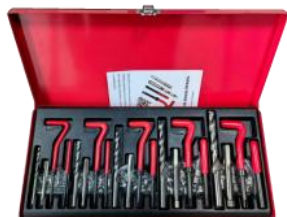
MODELO : XRGZ166