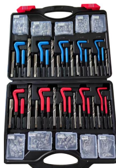
MODELO : XRGY338