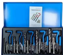
MODELO : XRYZ131