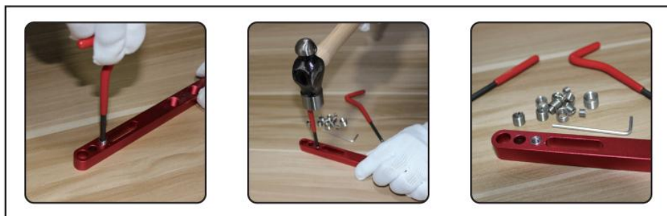
4. Screw coil into casting