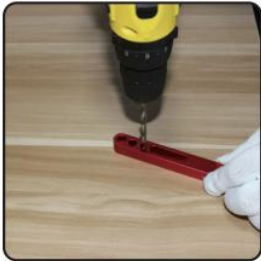
1. Drill out damaged thread using correctly sized drill bit(supplied)