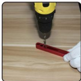
1. Drill out damaged thread using correctly sized drill bit(supplied)

Po zakończeniu podnieś narzędzie instalacyjne i użyj narzędzia do wyłamywania trzpienia, aby usunąć trzpień. W przypadku większych rozmiarów i kranów do świec zapłonowych, do usunięcia trzpienia należy użyć szczypiec z długimi końcówkami. Ze względu na wąskie i dokładne tolerancje nowy gwint jest zwykle mocniejszy niż oryginalny.