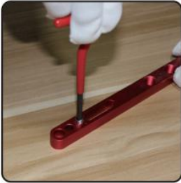
4. Screw coil into casting