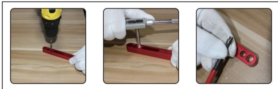
1. Drill out damaged thread using correctly sized drill bit(supplied)

Til na voltooiing het installatiegereedschap op en gebruik het tangbreekgereedschap om de tang te verwijderen. Gebruik voor grotere maten en bougiekranen een tang met een lange bek om de tang te verwijderen. Vanwege de smalle en exacte toleranties is de nieuwe draad normaal gesproken sterker dan de originele.