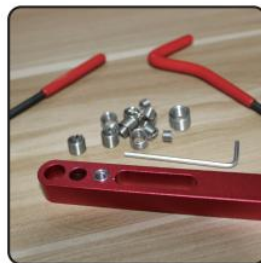
6. Thread is repaired and ready to use