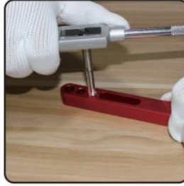
2. Tap re-drilled hole using tap supplied