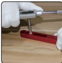
2. Tap re-drilled hole using tap supplied