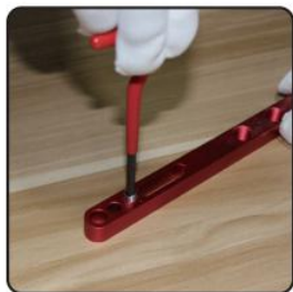
4. Screw coil into casting