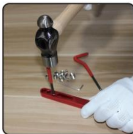
5. Using lug breaking tool, break off tag on insert