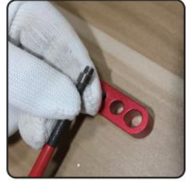
3. Load coiled insert into applicator