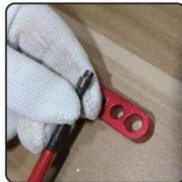
3. Load coiled insert into applicator