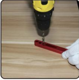
1. Drill out damaged thread using correctly sized drill bit(supplied)