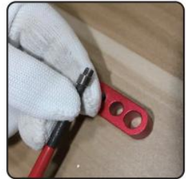
3. Load coiled insert into applicator