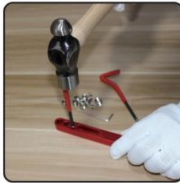
5. Using lug breaking tool, break off tag on insert