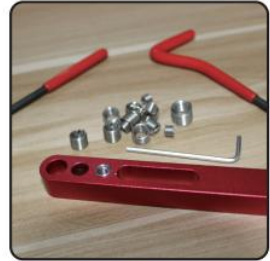
6. Thread is repaired and ready to use