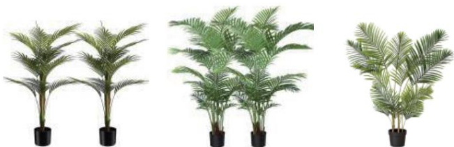
Codice articolo: LY-SS-001