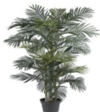
Codice articolo: LY-SS-004