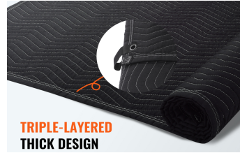
TRIPLE-LAYERED THICK DESIGN

it have triple-layered, Suitable for various scenes for sound barrier, insulation, and light-blocking. Easy to assmby ,It can hang on by Grommets