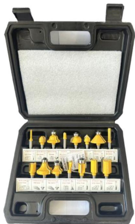
15 sztuk-A*6,35 MM