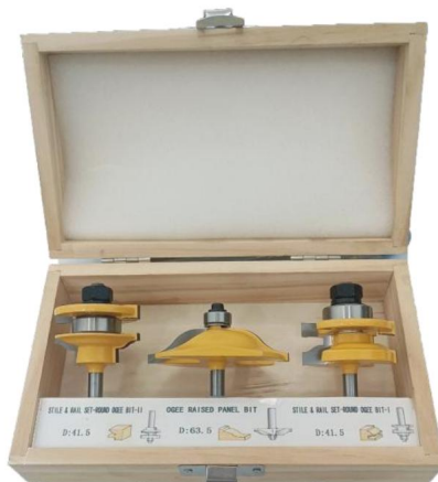
3 pezzi: A * 6,35 mm